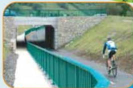
> Ouvrage d'art de Giez