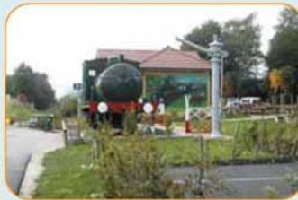
> Aire de repos de Bredannaz