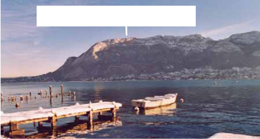
Le lac et les montagnes vus de Sevrier

Note le nom des montagnes dans les rectangles blancs.