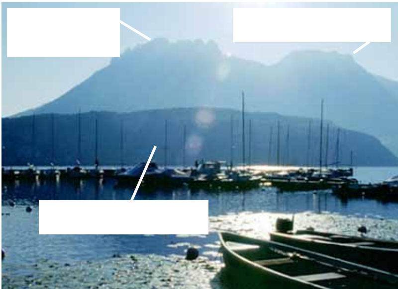
Le lac et les montagnes vus de Saint-Jorioz