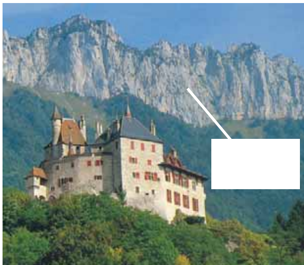
Château de Menthon-Saint-Bernard

Note le nom des montagnes dans les rectangles blancs.