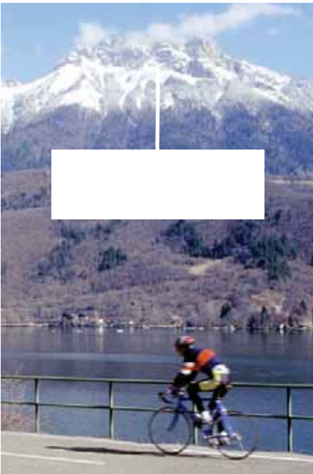
Le lac et les montagnes vus de Duingt