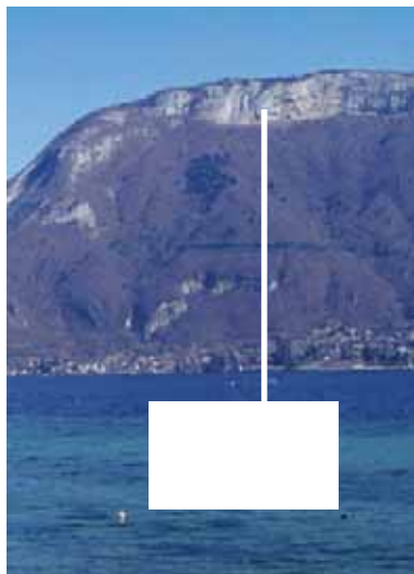
Vue de Sevrier