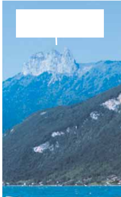
Vue de Doussard