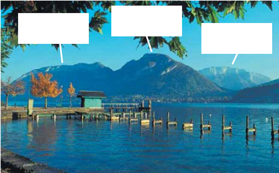
Le lac et les montagnes vus de Saint-Jorioz

Note le nom des montagnes dans les rectangles blancs.