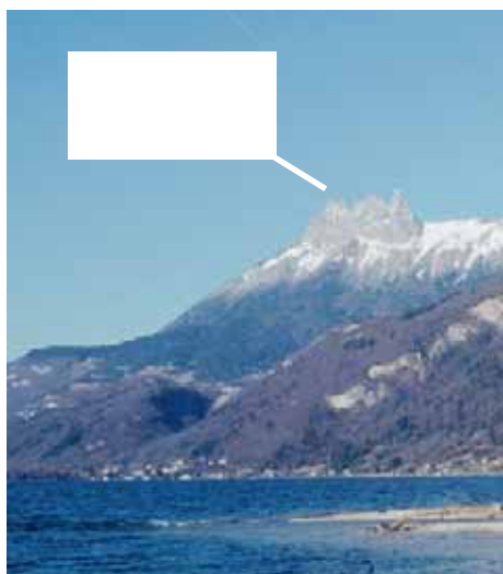
Vue de Doussard