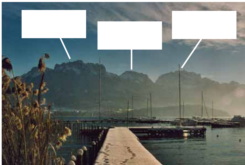
Le lac et les montagnes vus de Sevrier

Note le nom des montagnes dans les rectangles blancs.