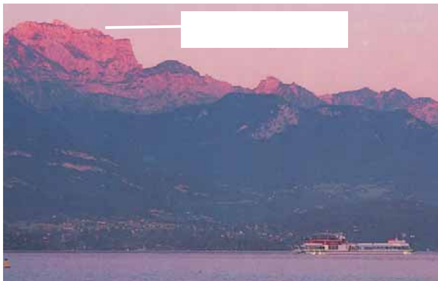
Le lac et les montagnes vus de Saint-Jorioz